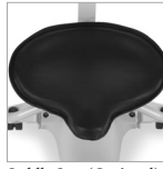
Saddle Seat (Optional)