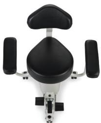
Silla gota de lágrima

Las configuraciones personalizadas de Surgistool, el espaldar totalmente ajustable y los brazos ofrecen el máximo apoyo para establecer la posición específica de su preferencia. El insuperable acceso al pedal, el estable y sinembargo móvil diseño se combinan para ofrecer la mejor banca clínica posible.